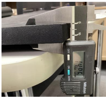
加工例① ゴムスポンジ